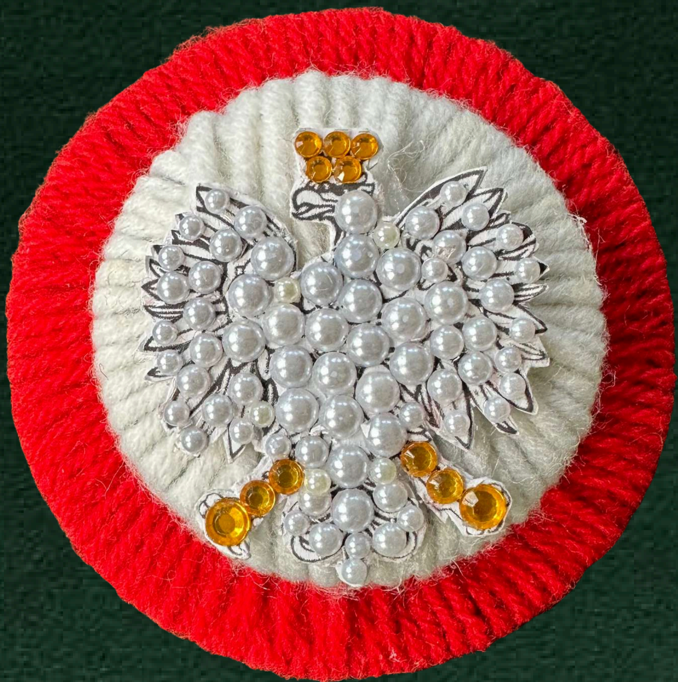
Wyróżnienie Kacper Dziewior