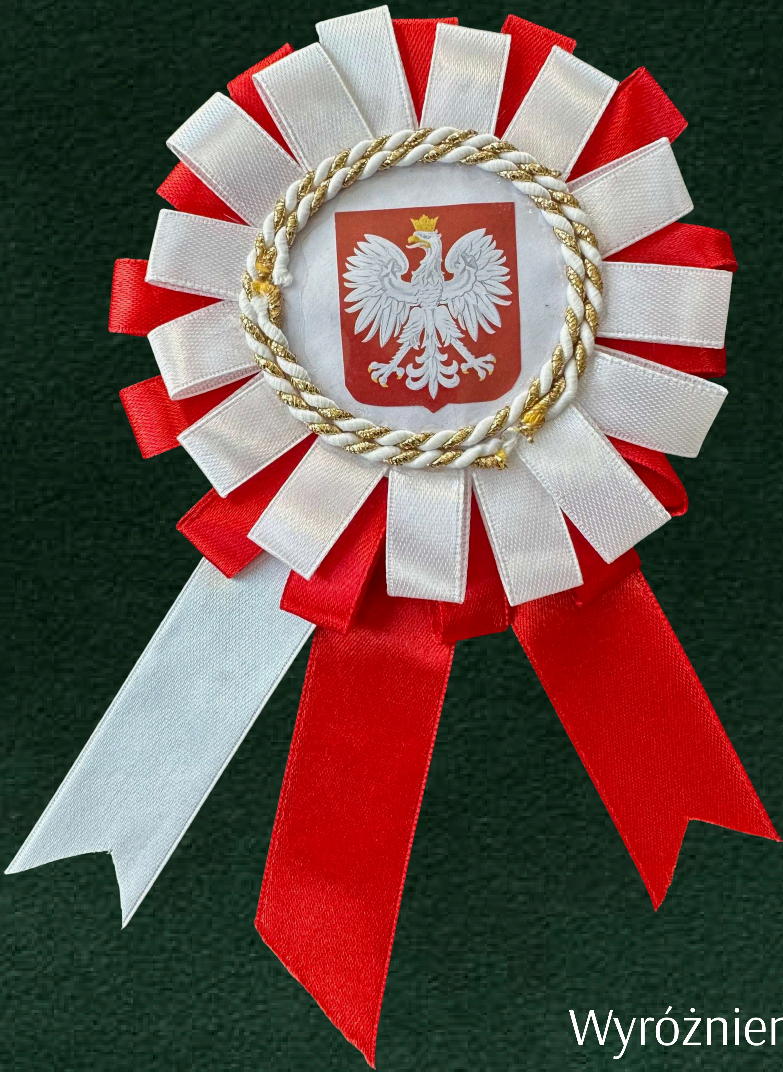
Wyróżnienie Tymoteusz Homoła